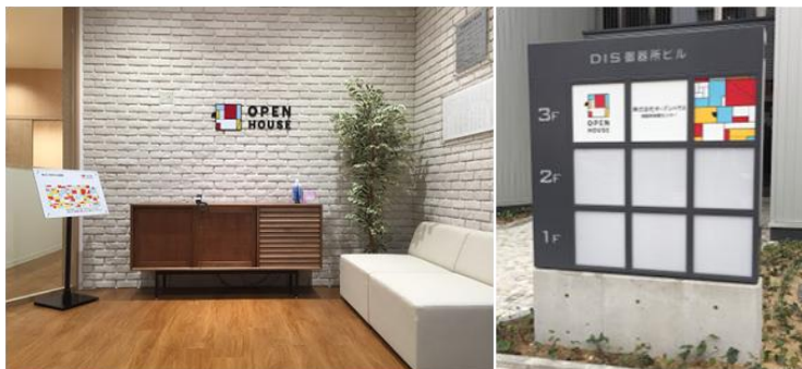
&lt;名古屋エリア拠点&gt;