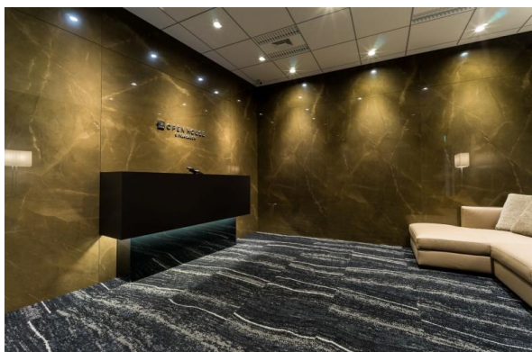
「OPENHOUSE GINZA SALON」入口

主に、資産家や投資家の方向けに独自のアメリカ不動産投資サービスを提供するのが、当社の「アメリカ不動産事業」です。そのコンセプトに合わせて、新拠点「OPENHOUSE GINZA SALON」は、既存店舗とは異なる「サロン」というスタイルを採用。接客スペースに加えて、海外不動産投資に関するセミナーを実施する会場も用意しております。