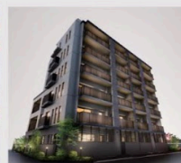
オープンレジデンス 大濠西 (2024年)