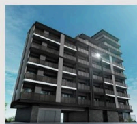
オープンレジデンス 高宮ブレイス (2024年)