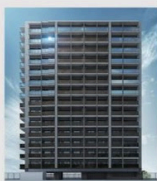
オープンレジデンス 博多住吉 (2023年)