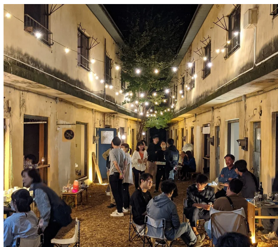
右：9月に関係者で行われたひがき寮でのイベントの様子