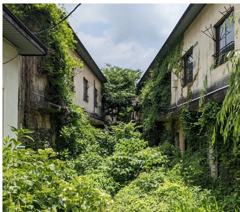
左：手入れ前のひがき寮の中庭

現在は廃業となっている温泉旅館「ひがきホテル」の従業員寮として利用されていた建物です。水上温泉街の路地裏に位置し、敷地の奥に向かい狭まっていく中庭の景観が特徴です。