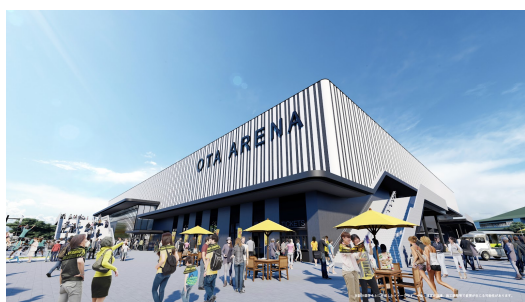
【太田市新アリーナプロジェクト】

現在の主な取組 ：太田市新アリーナプロジェクト・みなかみまちづくりプロジェクト(水上温泉街再生・みなかみほうだいぎスキー/キャンプ場)・桐生南高校跡地活用プロジェクト・群馬クレインサンダース・オープンハウスの森プロジェクト