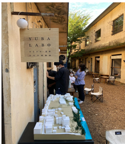
左：学生作成の湯原地区の模型展示の様子

「温泉街の暮らしを考える実験室」「新たなチャレンジを応援する場」としての旧ひがき寮の再生が始まりました。「うらろじ納涼ガーデン」と題しまして、まずはみなかみ町の近隣の皆様にお越しいただき、持ち寄りの食べものと飲みもので納涼会を開催。このエリアの未来について、一緒に考える場となりました。