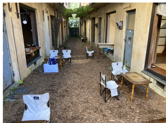
右：地元の皆様と学生達を中心に手入れされた中庭