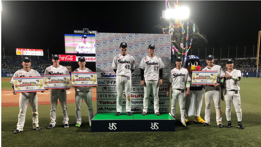
前回実施時の様子（2021年7月7日）

今年もやります、大盤振る舞い！神宮球場での勝利試合において、ヒーローインタビューに選ばれた選手へ金一封を贈呈する「オープンハウス・ヒーロー賞」。通常は1～3名の選出ですが、この日勝利した場合には最大9人のヒーローを選出いたします。